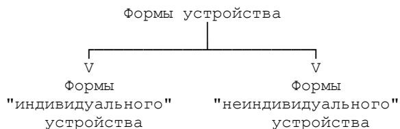
Схема N 1

При "индивидуальном" устройстве (семейное устройство, устройство в семью) попечение о ребенке передается строго определенному физическому лицу (лицам), при выборе которого применяются установленные законом критерии. К таким формам устройства относятся усыновление ребенка, а также опека (попечительство) <1>.